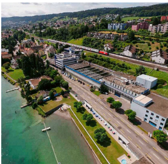
Luftaufnahme der bestehenden ARA Thalwil, die zur ARA Zimmerberg ausgebaut werden soll.