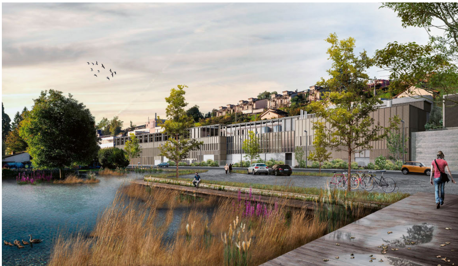
Visualisierung der künftigen ARA Zimmerberg, die schon bei der Planung bezüglich Nachhaltigkeit umfassend geprüft wurde.

Der Standard «Nachhaltiges Bauen Schweiz» ist im Hochbau seit Jahren mit Erfolg im Einsatz. Nun folgt sein Pendant für den Tiefbau. Es wird bei der Planung der neuen ARA Zimmerberg (ZH) erstmals angewendet.